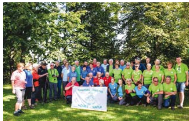
Srečanje obmejnih PD

Izlet Rogla – Lovrenška jezera za mlade planince, njihove starše, dedke, babice je bil na izredno lep, a