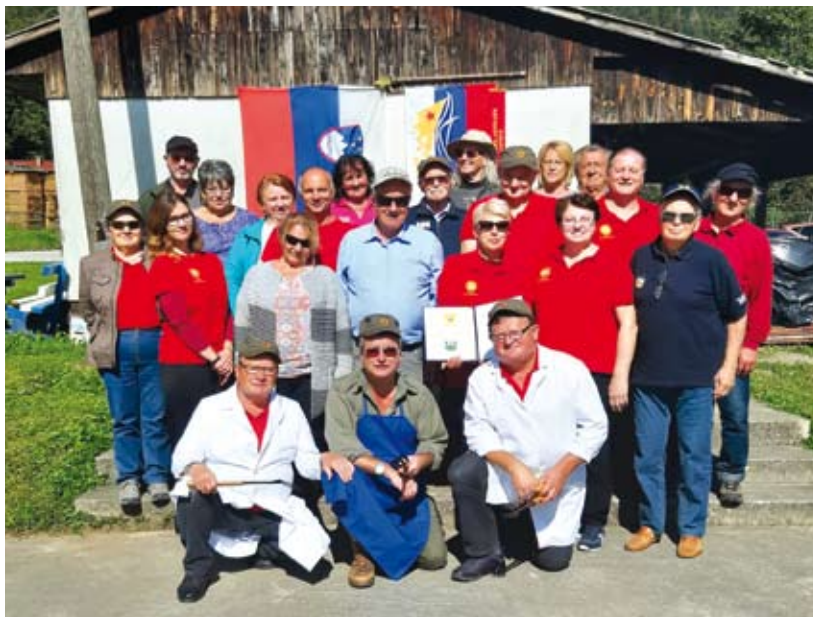
Jesensko srečanje članov KO za vrednote NOB Podvelka.