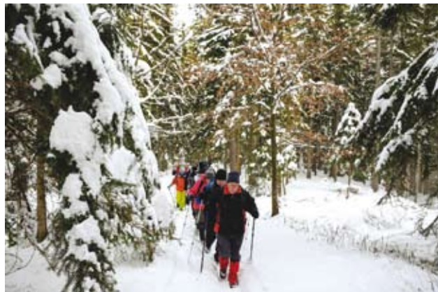
Pesnik – Ribniška kočica